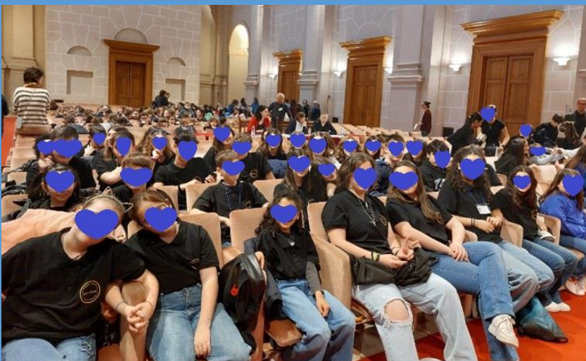
Uno scatto prima dell'esibizione