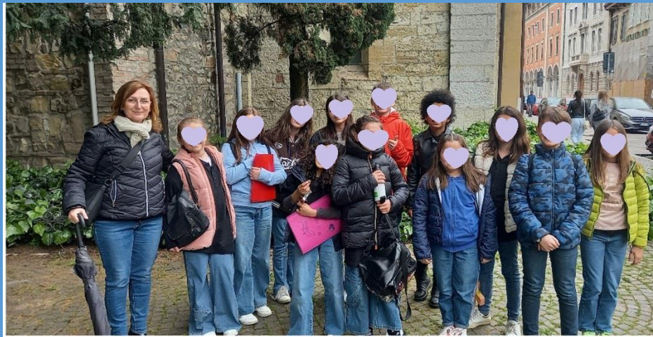
Alunni di quarta e quinta primaria