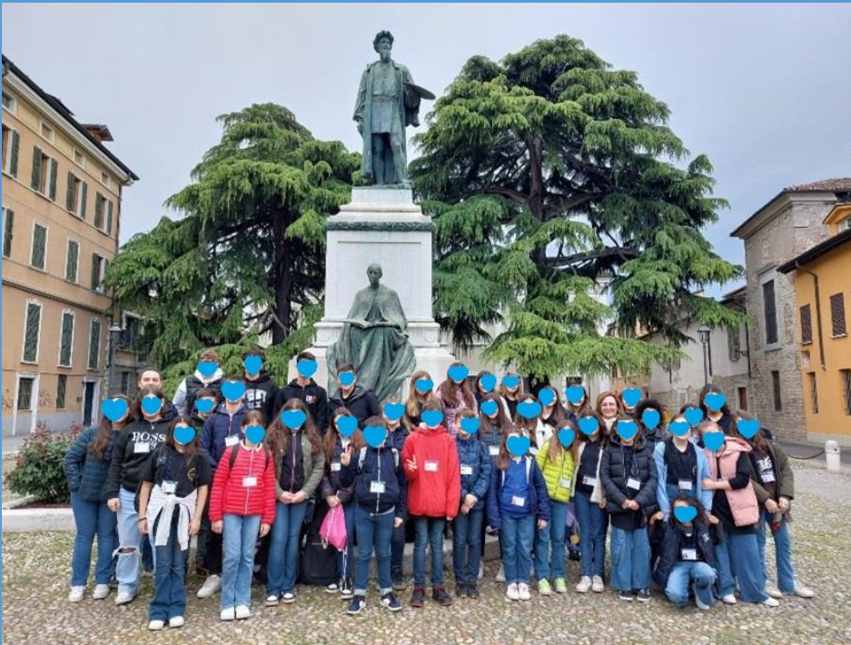
Coro-Orchestra al completo (Primaria e Secondaria)